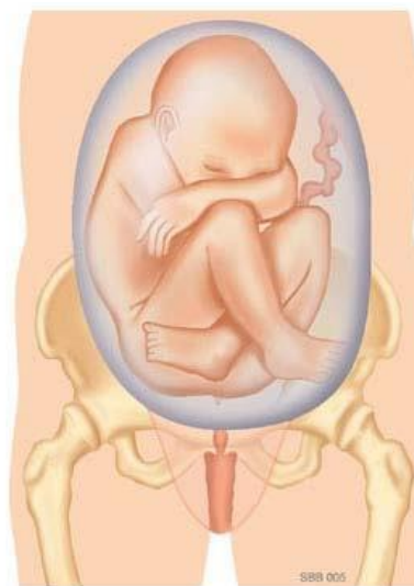
Volkomen stuitligging: De benen zijn gebogen. De voeten liggen bij de billen ("kleermakerszit").