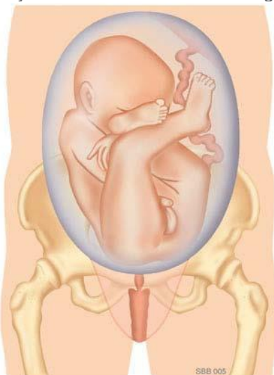
Onvolkomen stuitligging: De benen liggen omhoog naast het lichaam.

Sommige kinderen liggen tegen het einde van de zwangerschap in stuitligging. Dat is bij 3 – 4% van de zwangerschappen het geval. Bij een stuitligging ligt het hoofd van het kind boven in de baarmoeder. De billen liggen beneden bij de ingang van het bekken. Er zijn verschillende soorten stuitligging.