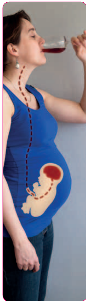
Als je alcohol drinkt, drinkt je baby mee.